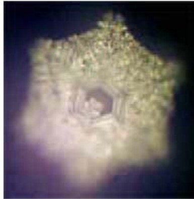
alte, vergessene Heilquelle

Dr. Masaru Emoto zeigt uns einzigartige Fotos von Wasserkristallen. Jede Art von Schwingungen mit guter oder negativer Information wird vom Wasser gespeichert. Dies ist ein Hinweis auf die Beziehung zwischen der Schönheit und Ausprägung der Kristallform und der Wasserqualität. Die Bilder sprechen für sich: