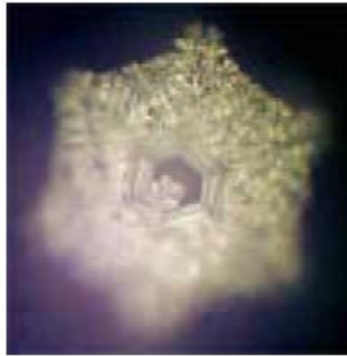
alte, vergessene Heilquelle

Dr. Masaru Emoto zeigt uns einzigartige Fotos von Wasserkristallen. Jede Art von Schwingungen mit guter oder negativer Information wird vom Wasser gespeichert. Dies ist ein Hinweis auf die Beziehung zwischen der Schönheit und Ausprägung der Kristallform und der Wasserqualität. Die Bilder sprechen für sich: